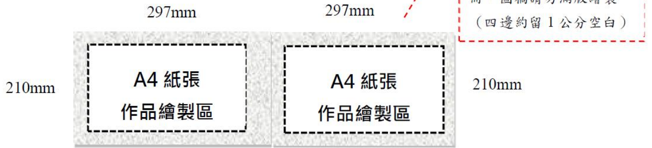
圖 2 作品紙張規格示意圖 (1 組 = 兩頁)